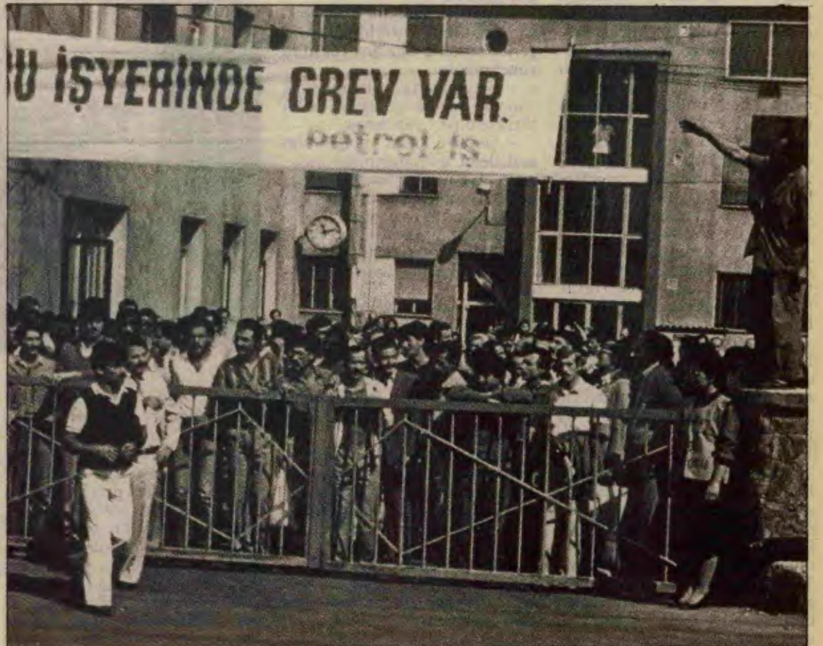
İşçi sınıfının devrimci mücadelesi resmi sosyal demokratların devrimi engelleme çabasını boğacaktır.