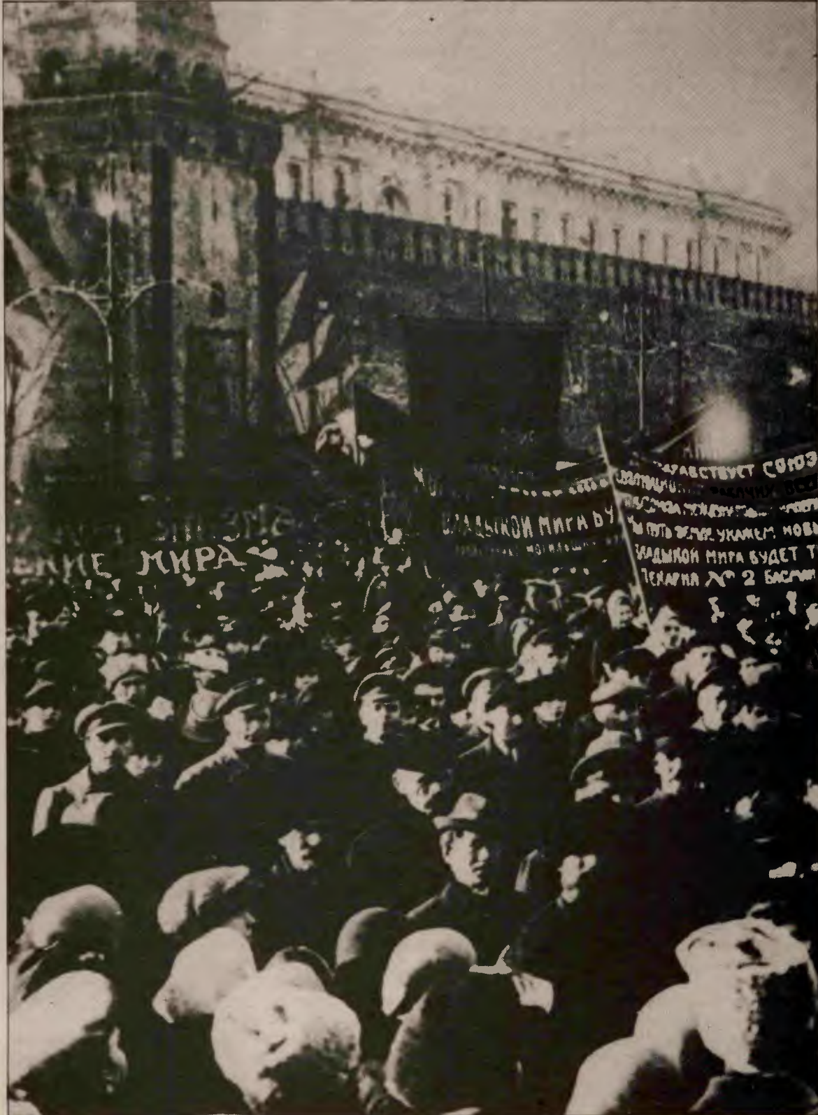
Gorbaçov'un reformlarının mantığı proletarya diktatörlüğünün kurumlaşmasına dönük değildir.

Üçüncüsü, Lenin, ekonomik alanda garip ödümler verildiği zaman, devletin proleter karakteri üzerinde bin kat daha fazla durmuştur. O ödümlerin geçici olmasının ve amacına ulaşma-